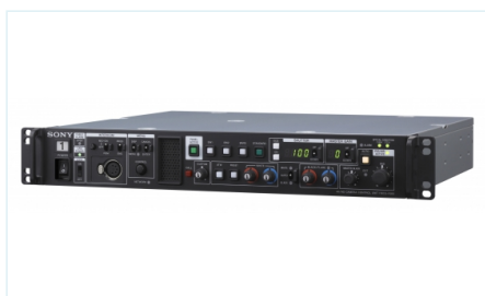
HXCU-FB80 HXC-FB80 摄像机的 4K/高清摄像机控制单元