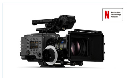
CineAltaV2 全画幅数字电影摄影机带有内部 X-OCN 录制功能，可选择 8K 和 6K 成像器。