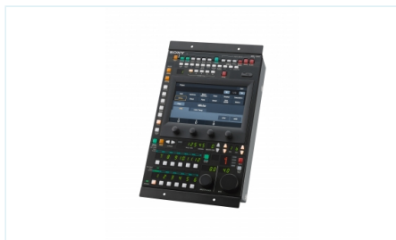
MSU-3500 主设置单元，适用于系统摄像机（立式）的多摄像机远程控制面板