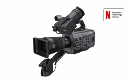
PXW-FX9 了解索尼全幅 6K 成像器摄像机 FX9，支持高速混合 AF、双基 ISO 和 S-Cinetone™ 色彩学。