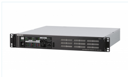
HDRC-4000 HDR 制作转换器单元