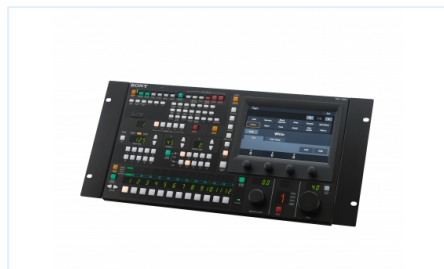
MSU-3000 主设置单元，适用于系统摄像机（卧式）的多摄像机远程控制面板